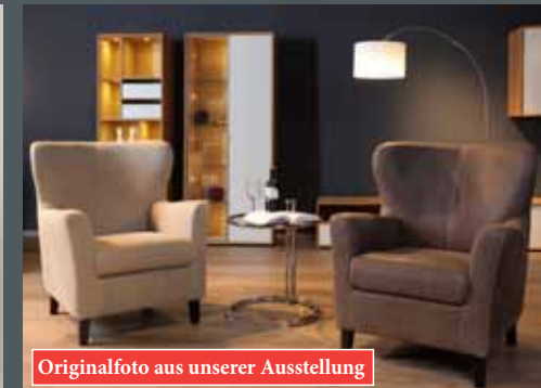
Originalfoto aus unserer Ausstellung